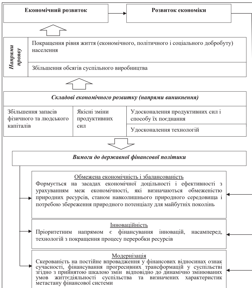
Рис. 1. Вимоги до державної фінансової політики у контексті забезпечення економічного розвитку

Слід зауважити що термін «модернізація», який походить від англійського «modernization», тобто «осучаснення» та застосовується для опису різнопланових одночасних змін, будь-яких динамічних, свідомо регульованих та якісних покращань у різних сферах соціуму, відносно ДФП може використовуватися у двох контекстах: