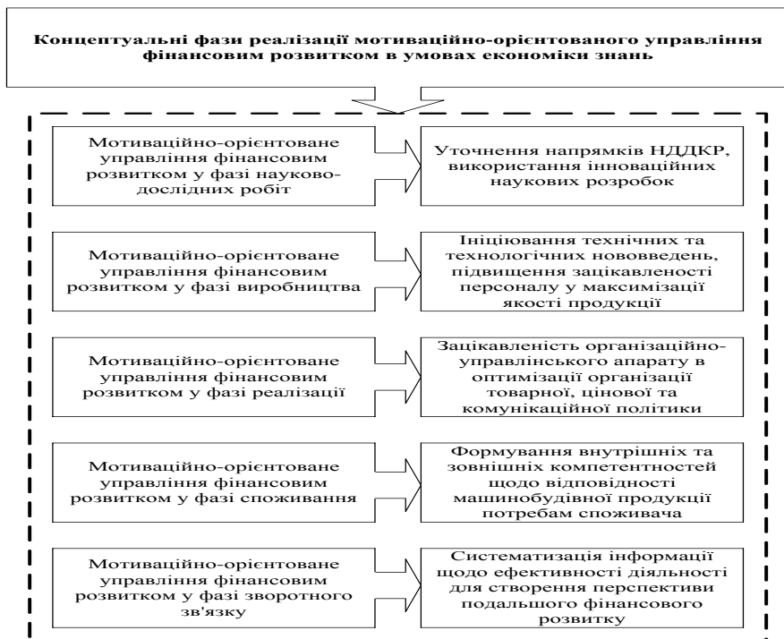
Рисунок 3. Систематизація фаз реалізації мотиваційно-орієнтованого управління фінансовим розвитком машинобудівних підприємств в умовах економіки знань

концептуальних блоків, спрямованих на створення можливостей прийняття ефективних управлінських рішень на стратегічному та тактичному рівнях на основі систематизації найбільш впливових на досягнення головної мети в умовах економіки знань показників оцінки фінансового розвитку.