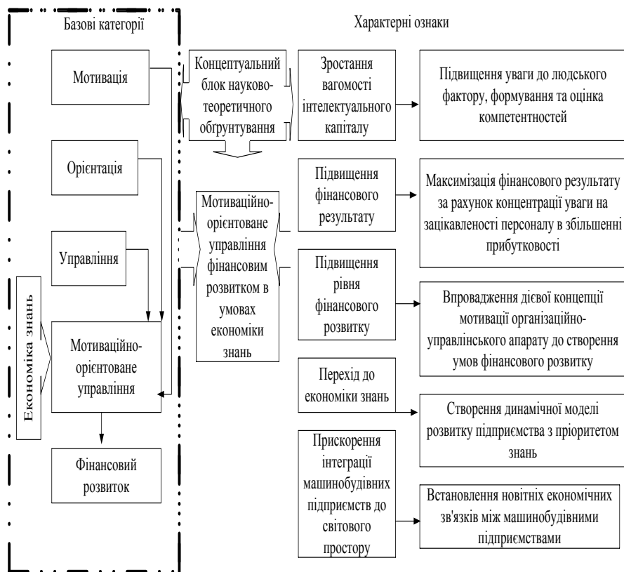
Рисунок 2. Концептуальний блок науково-теоретичного обґрунтування мотиваційно-орієнтованого управління фінансовим розвитком машинобудівних підприємств

двох підсистем здатна збільшити адаптивність машинобудівного підприємства до вимог зовнішнього середовища та, як наслідок, сприяти розвитку фінансових відносин. Концептуальний блок науково-теоретичного обґрунтування мотиваційно-орієнтованого управління фінансовим розвитком машинобудівних підприємств містить у собі ключові елементи теоретичного базису формування та реалізації основних положень мотиваційно-орієнтованого управління фінансовим розвитком (рис. 2).