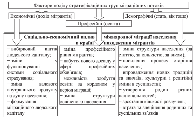
Рис. 1. Вплив міжнародної міграції на розвиток суспільства країни походження мігрантів з урахуванням поділу міграційних потоків на стратифікаційні групи

Описуючи вплив різних стратифікаційних груп на суспільство, варто навести думку В.І. Томас і Ф. Знанецкі [8], які, аналізуючи міграційні потоки в Польщі в XIX і XX ст., писали про кризу суспільних відносин, переважно концентруючи увагу на дезорганізації суспільства. Це, своєю чергою, впливає на зміну традиційної моделі родини. А. Бобек [9], досліджуючи це питання, зазначає, що мігранти, які залишили