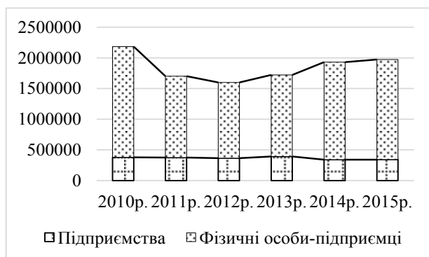
Рис. 1. Кількість суб'єктів господарювання, одиниць