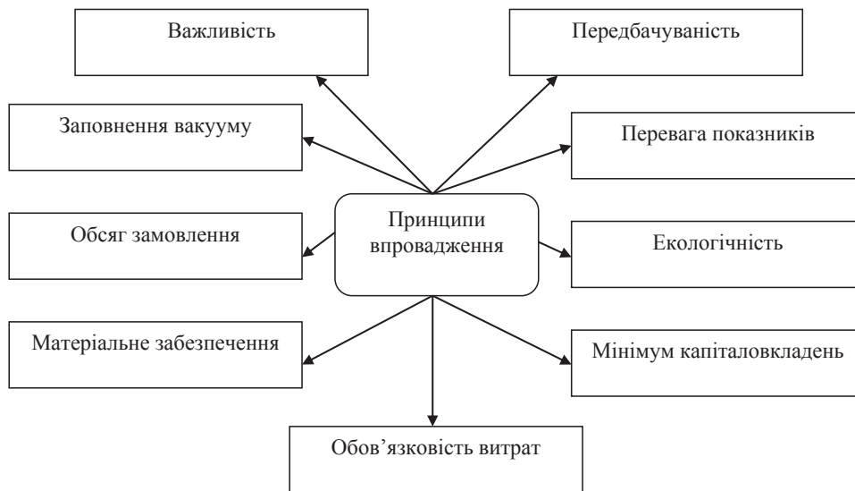
Рис. 3. Принципи реалізації проекту реструктуризації на промисловому підприємстві

багато в чому схожі за своїми цілями, завданнями і функціональністю.