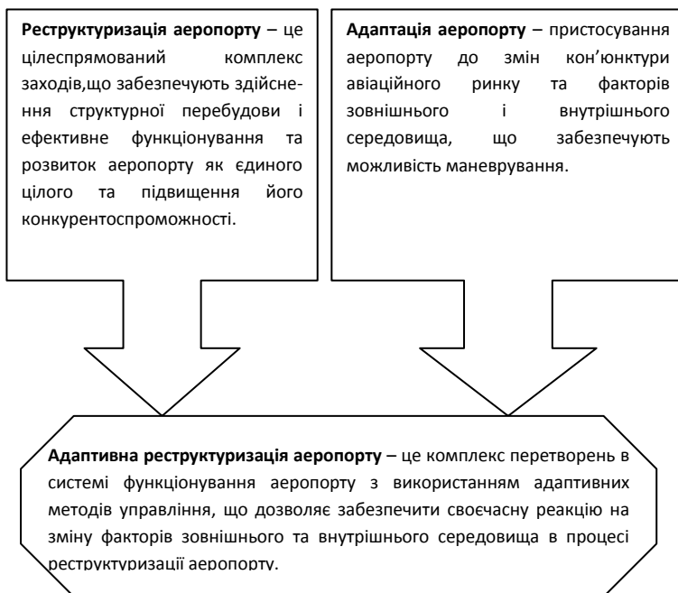
Рисунок 1. Сутність поняття «адаптивна реструктуризація аеропорту»

Адаптивні організаційні структури поєднали в собі позитивні риси функціональних та дивізіональних структур. Ці структури дозволяють скоротити кількість управлінських рівнів та забезпечити гнучкість пристосування до ринкових змін [4].