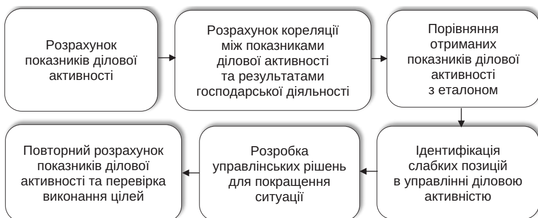
Рис. 1. Схема управління діловою активністю суб'єкта підприємницької діяльності