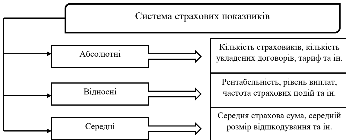
Рис. 1. Система страхових показників [1]

Для забезпечення якісного статистичного аналізу та порівняння національних страхових