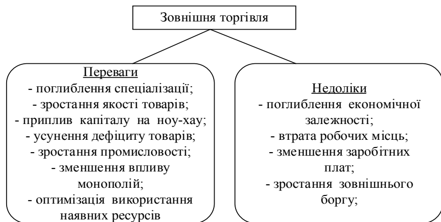
Рис. 2. Переваги та недоліки зовнішньої торгівлі

Ринок ЄС є найбільшим ринком країн – сусідів України та значним джерелом інвестицій, необхідних для її технологічної модернізації та еконо-